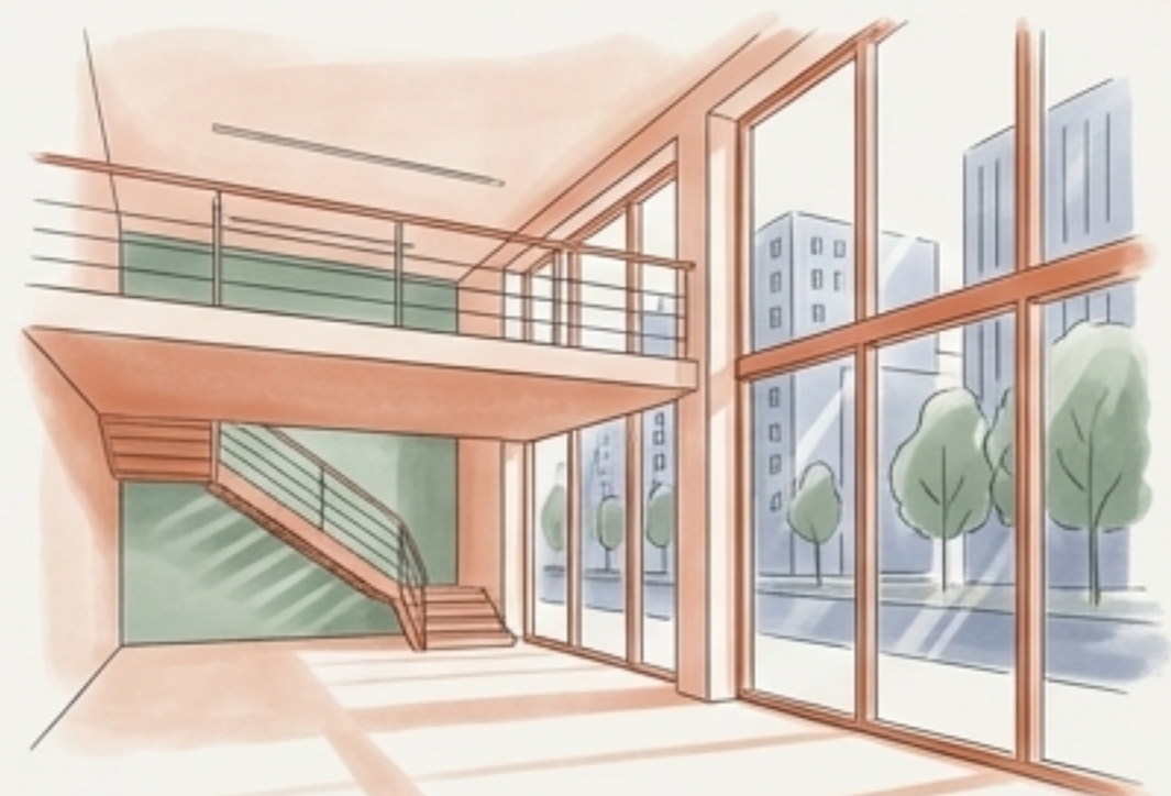
Kameralna siedziba przy Marszałkowskiej 34/50