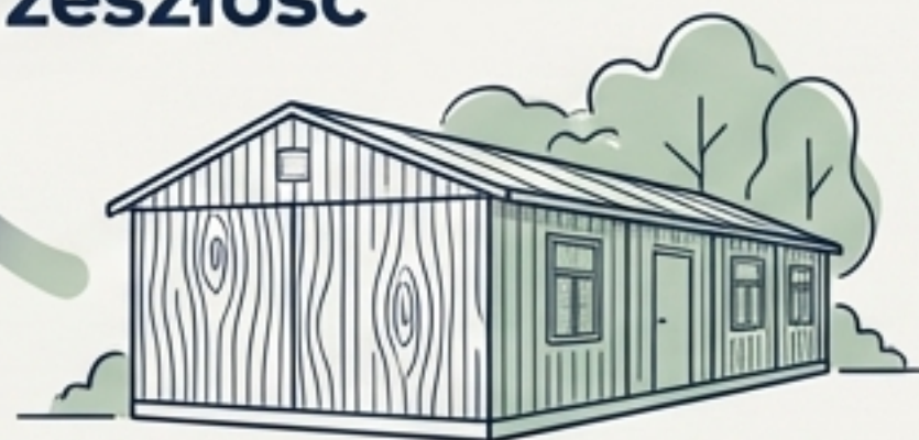
Baraki przy ul. Batorego